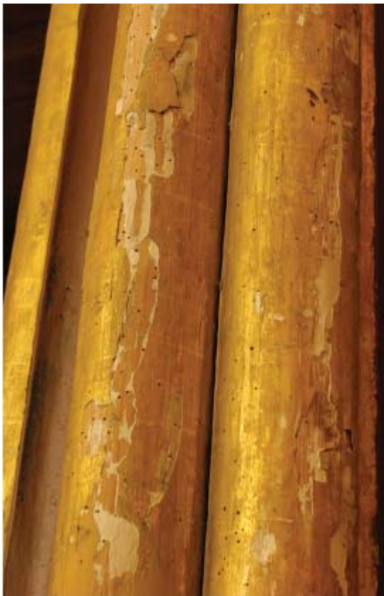
Dobre Miasto, bazylika, empora organowa, fragment złożonych na poler profili pionowych

wcześniejszych konserwacji empora została całkowicie przemalowana farbą olejną, bez uzupełnień