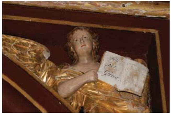
Dobre Miasto, bazylika, empora organowa, figura anioła; widoczne ubytki gruntów, złocień i polichromii

ubytków gruntu i wcześniejszej warstwy malarskiej. Farba w wielu miejscach łuszczy się. Na wszystkich powierzchniach widać ubytki monochromii odsłaniające grunt lub wcześniejsze przemalowania. W wyjątkowo złym stanie są złocenia na profilach. Złoto odspaja się na dużych powierzchniach i odpada wraz z gruntem. Na wszystkich elementach widoczne są rozległe ubytki obu warstw. Figury aniołów znajdują się również w złym stanie. Rzeźby wymagają miejscowych rekonstrukcji snycerskich (palce, fragmenty skrzydeł). Widoczne są znaczne ubytki złocień wraz z gruntem. Partie polichromowane całkowicie przemalowane. Podniebie empory oraz arkady od strony wejścia pozostały niewykończone, z widoczną konstrukcją drewnianych elementów.