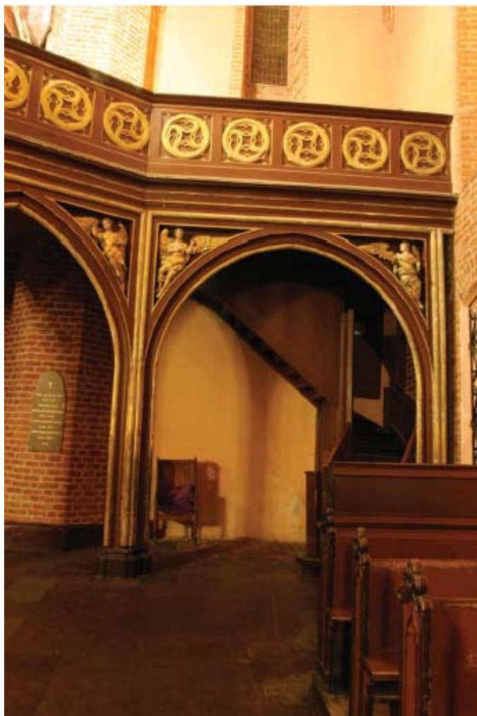
Dobre Miasto, bazylika, empora organowa, fragment, widok w kierunku pn.-zach.

Konstrukcja empory wykonana została z drewna malowanego brązową farbą olejną. Chór muzyczny dźwiga siedem ostrołukowych arkad wspartych na filarach o złożonych profilach. Trzy środkowe arkady rozciągające się na szerokość nawy głównej zostały wyrzalicowane. W pachach łuków umieszczono rzeźby przedstawiające anioły o złożonych szatach i skrzydłach. Pierwotnie trzy-mały one zapewne instrumenty muzyczne tworząc chóry anielskie. Balkon empory dekorują kwadratowe płytki wypełnione złożonymi rozetami.