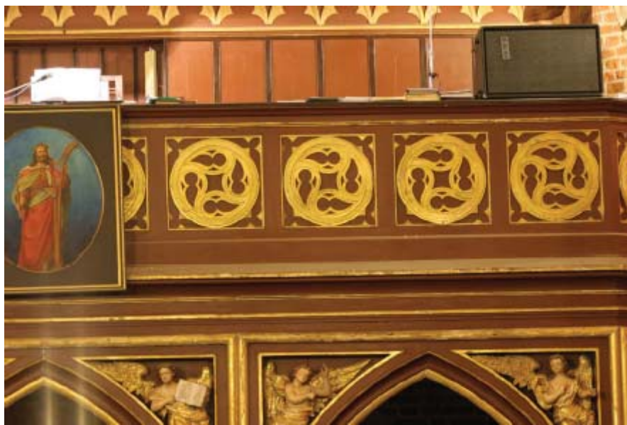
Dobre Miasto, bazylika, empora organowa, fragment balkonu