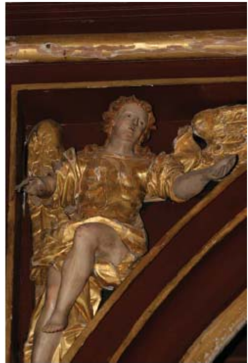
Dobre Miasto, bazylika, empora organowa, figura anioła

Szczegółowe badania konserwatorskie pozwolą ustalić, które z elementów konstrukcyjnych pochodziły z wcześniejszej empory, a które powstały w latach 80. XIX w.